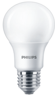
E27 A60 FR