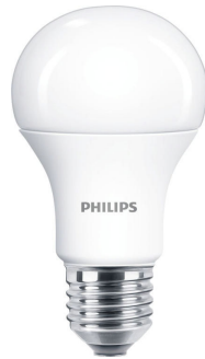
E27 A60 FR