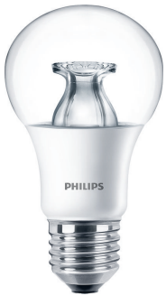
E27 A60 Clear