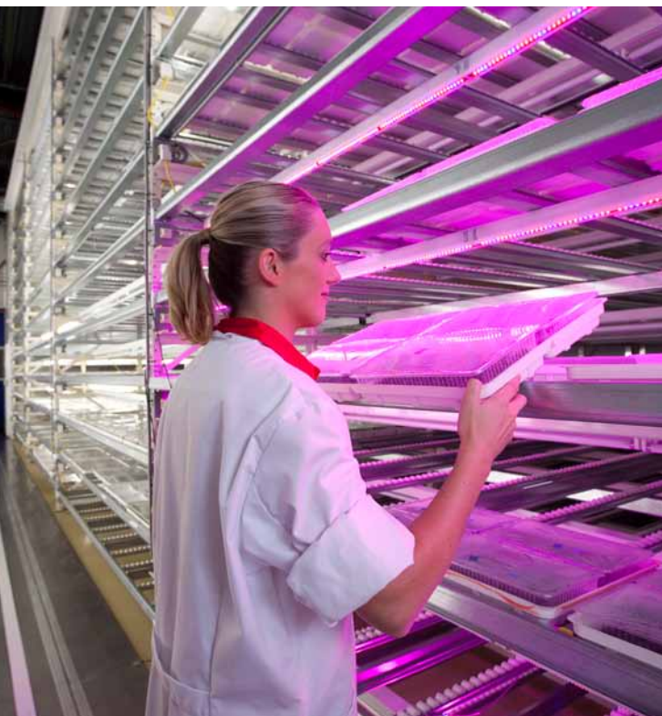
Ter vergelijking: links TL groeilicht, rechts LED groeilicht